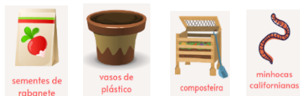
Figura 1: Materiais usados no projeto.

O colégio recebeu, no início de fevereiro, uma composteira do projeto da cidade, chamado "Palotina Recicla o Orgânico", a qual recebeu manutenção de três em três dias. Foram adicionadas minhocas californianas, as mais indicadas para o processo.