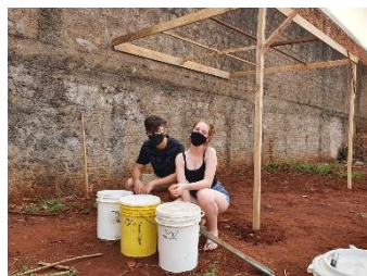
Figura 2: Montagem da estufa.

Foi montada uma estufa improvisada, que recebeu as 40 mudas de rabanete