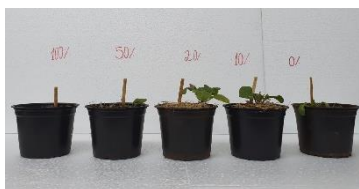
Figura 3: Resultados visíveis.

As aplicações foram realizadas todos os dias. Após 50 dias da sementeira, foi feita a avaliação da massa fresca da raiz, massa fresca da parte aérea e número de folhas.