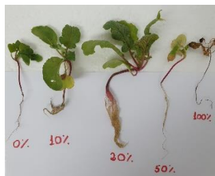
Figura 4: Resultados. Fonte: Os autores, (2021)

Para a massa fresca da parte aérea e da raiz, a concentração 20% foi superior, melhorou o desenvolvimento e acelerou a produção e rentabilidade da planta.