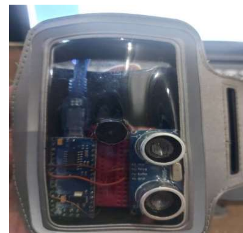
Imagem do dispositivo:

const int pinoBuzzer = 10; int cm = 0; long readUltrasonicDistance(int triggerPin, int echoPin) { pinMode(triggerPin, OUTPUT); digitalWrite(triggerPin, LOW); delayMicroseconds(2); digitalWrite(triggerPin, HIGH); delayMicroseconds(10); digitalWrite(triggerPin, LOW); pinMode(echoPin, INPUT); return pulseIn(echoPin, HIGH); } void setup() { } void loop() { cm = 0.01723 * readUltrasonicDistance(7, 6); if (cm <= 50) { tone(pinoBuzzer, 1500); } else { noTone(pinoBuzzer); } }