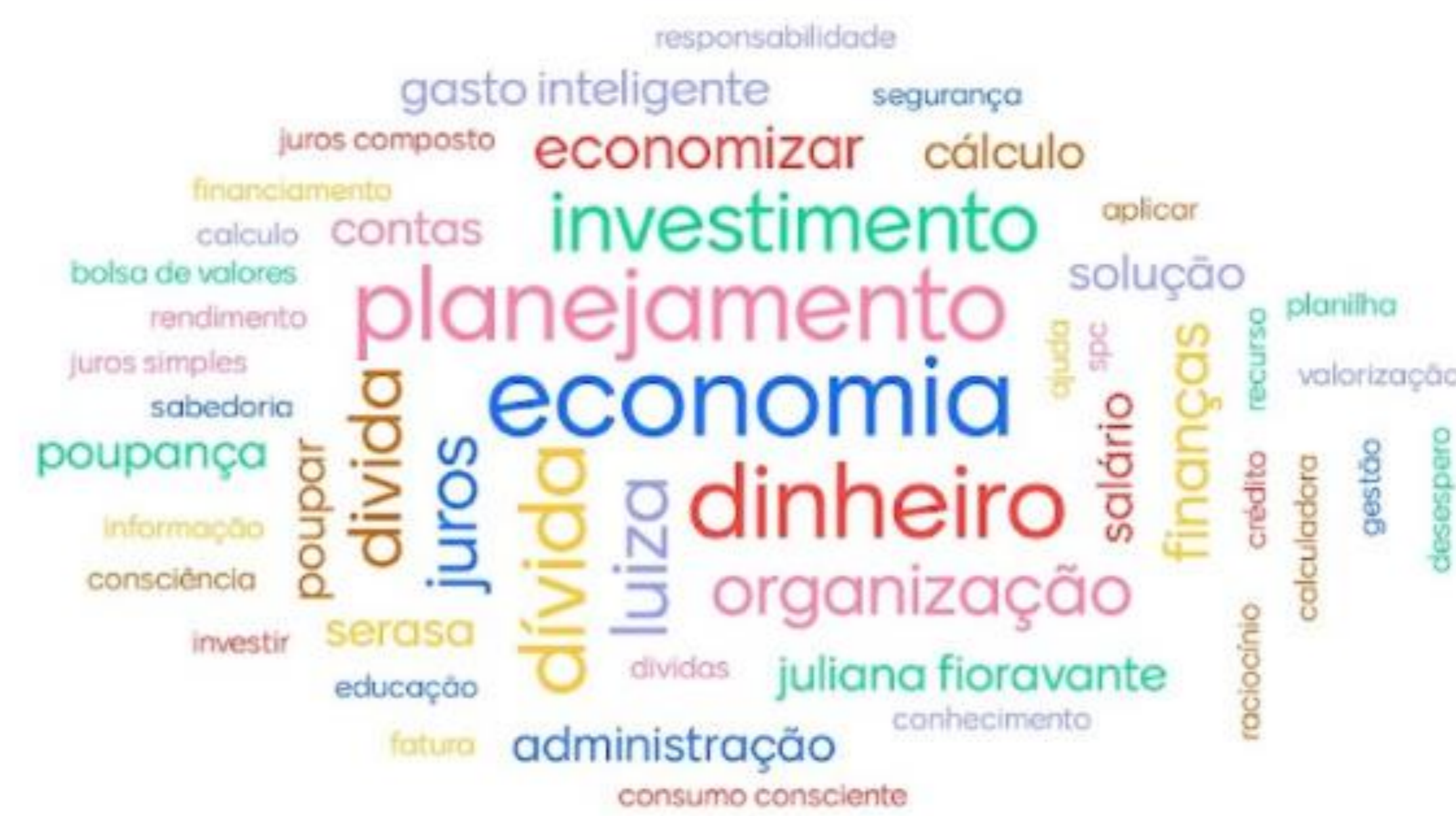
Figura 1: Nuvem de palavras produzida na estação arte através do site Mentimeter