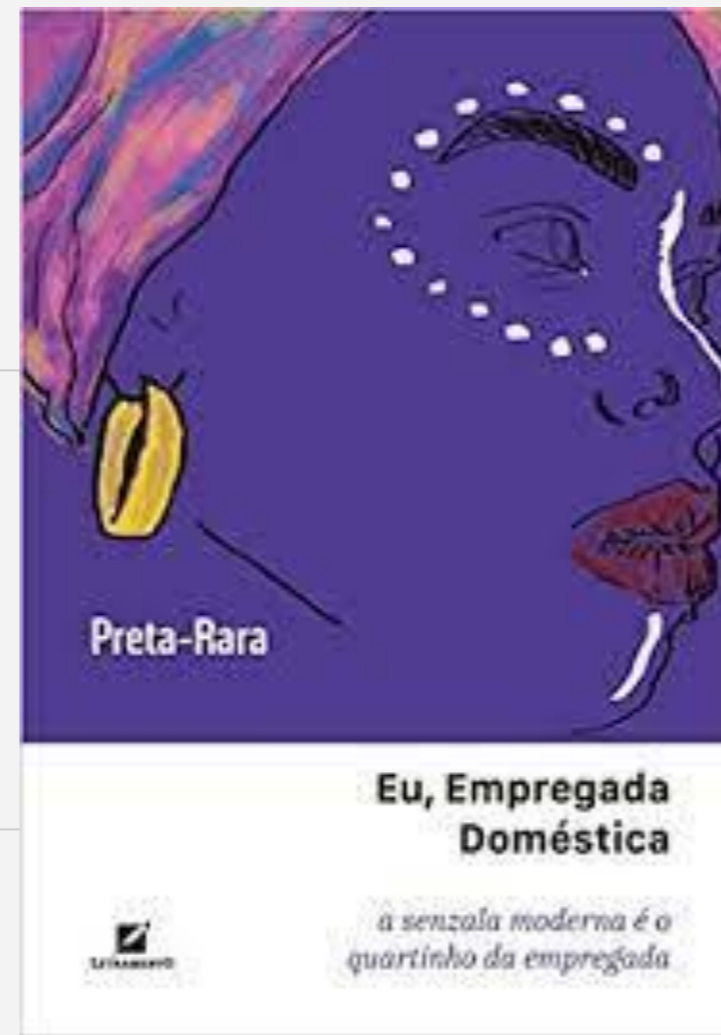
FIGURA 1: captura eletrônica do livro Eu empregada doméstica (autoria própria)

Apontar os problemas de raça, classe e gênero no trabalho doméstico. Além de consultar livros, examinamos jornais do séc. XIX para conhecermos quem pertencia a classe trabalhadora doméstica dessa época e como eram tratados esses trabalhadores. O livro Eu empregada doméstica da autora Preta Rara foi muito importante para obtermos informações e experiências de trabalhadoras domésticas atuais. Esse trabalho é uma pesquisa exploratória.