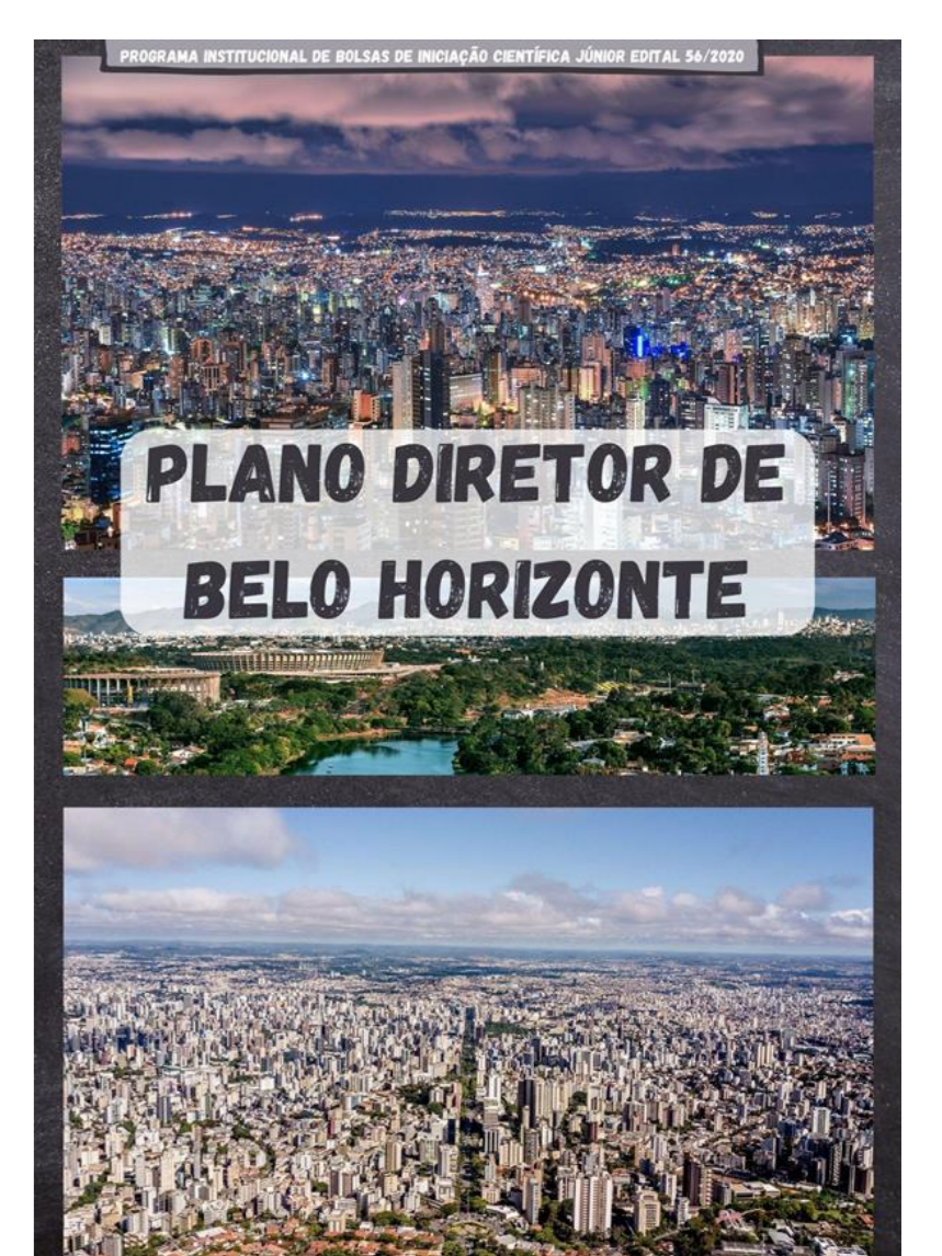
Figura 2- Capa da cartilha

A cartilha conseguiu abordar os principais tópicos que favorecem a formação cidadã dos estudantes. Por meio do emprego de imagens, diagramas, mapas e muitos recursos visuais, a cartilha se desvincula da linguagem estritamente acadêmica e teórica que muitos materiais informativos possuem. É um material leve, pensado para que qualquer indivíduo possa ler e entender como funciona seu entorno. Uma vez que a cartilha tem um espaço limitado para discorrer sobre assuntos complexos e extensos que muitas vezes possuem raízes históricas, alguns temas tiveram que ficar de fora do material, como o Estatuto da Cidade que foi abordado de forma rápida no material. Dito isso, a cartilha favorece a compreensão dos instrumentos de planejamento urbano na cidade e, também, auxilia no entendimento do Plano Diretor.