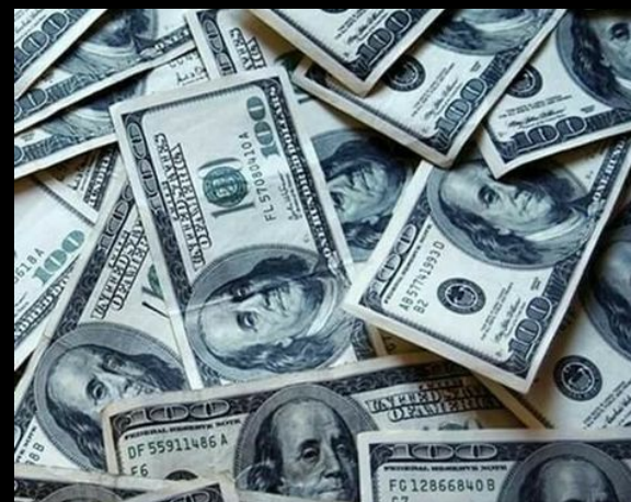
O NOVO- RIQUISMO

A TEORIA DA CLASSE OCIOSA (1899), THORSTEIN VEBLEN + PESQUISAS E OBSERVAÇÕES EMPÍRICAS