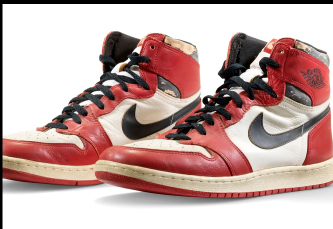
O FENÔMENO DO HYPE