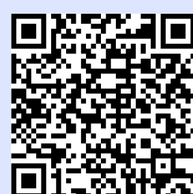
QR CODE para o acesso ao protótipo do site