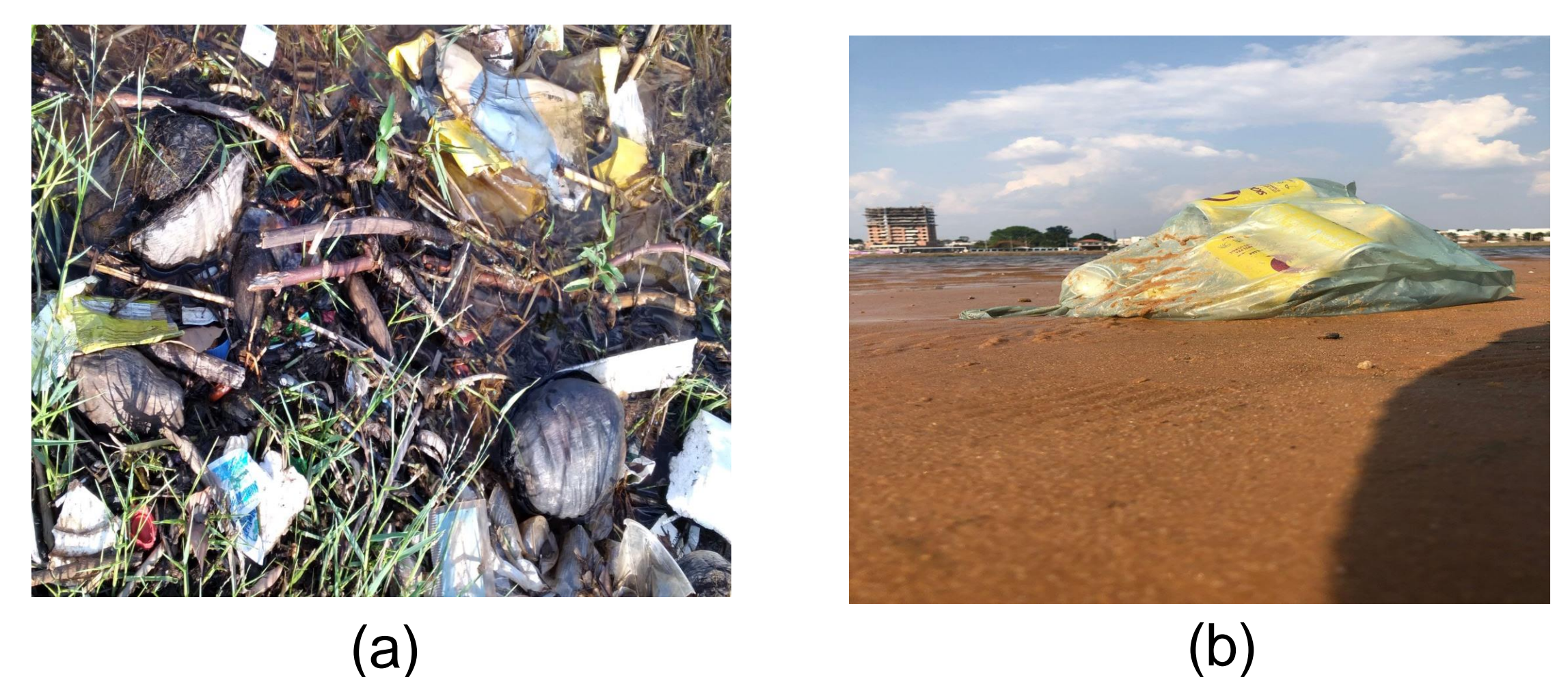
Figura 2 (a e b) - Resíduos sólidos encontrados na praia

Ao decorrer das coletas foram identificados um grande acúmulo de lixo no ambiente, resultado do descarte incorreto de resíduos sólidos, como podem ser ilustrado na figura 2.