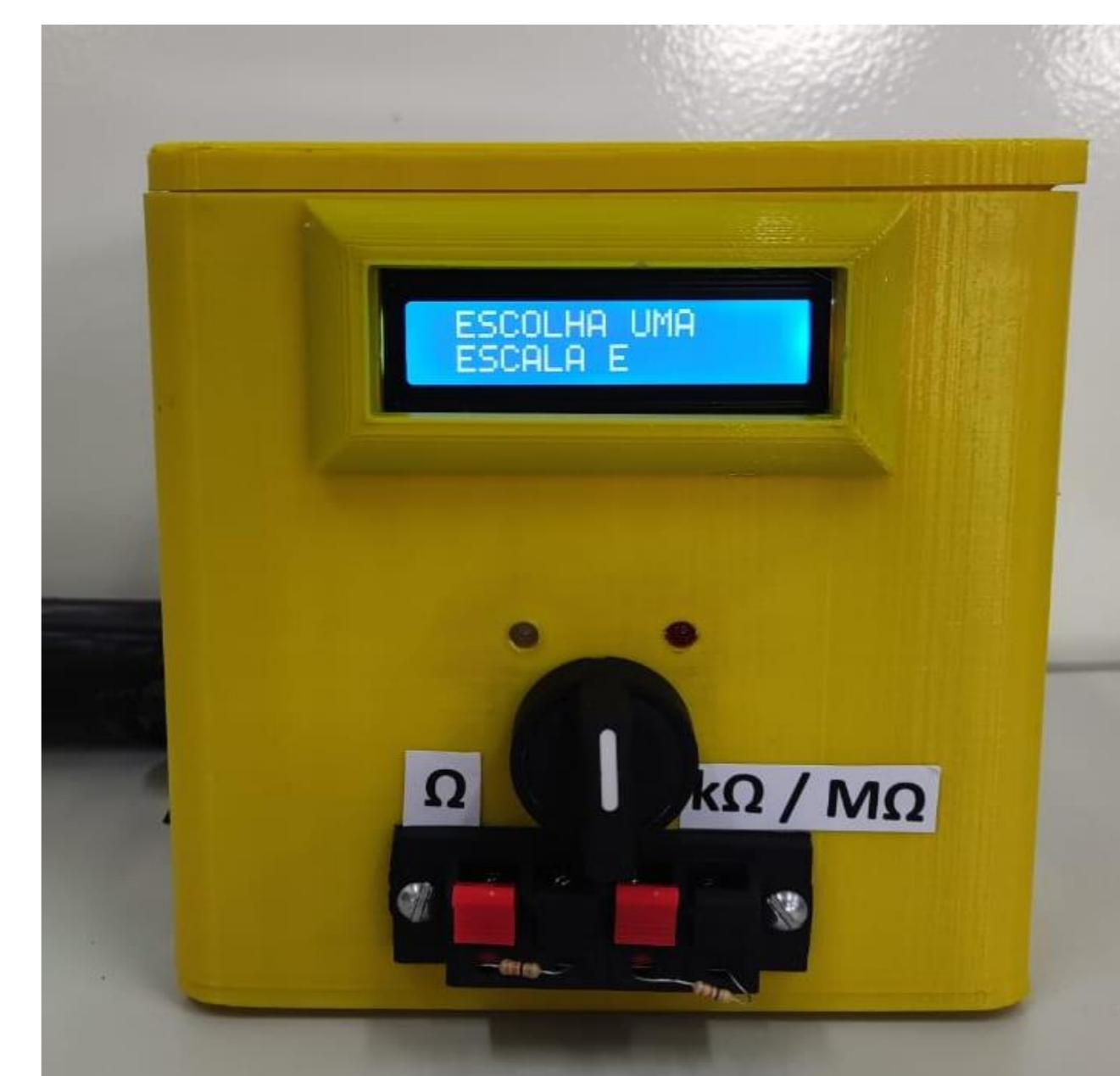
Figura 3- Protótipo em funcionamento

Na figura 3 podemos ver o protótipo em funcionamento.