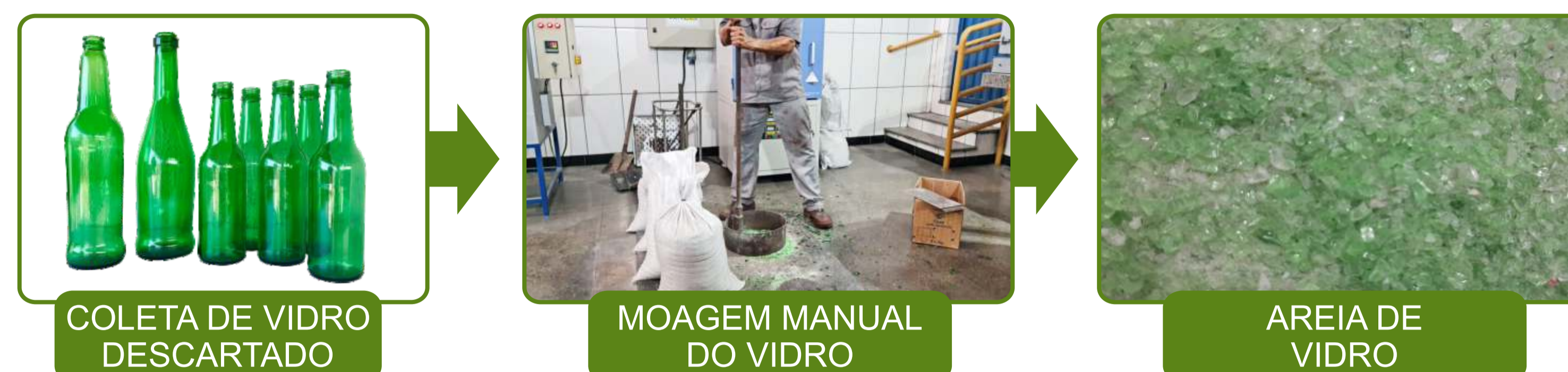
Figura 2: Etapas da reciclagem de vidro local Fonte: Os autores, 2022.