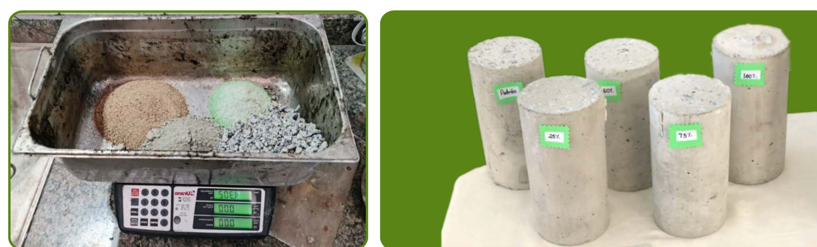
Figura 3: Etapas da produção dos corpos de prova

Série de corpos de prova com porcentagem de areia de vidro iguais a 0% (padrão), 25 %, 50%, 75% e 100%