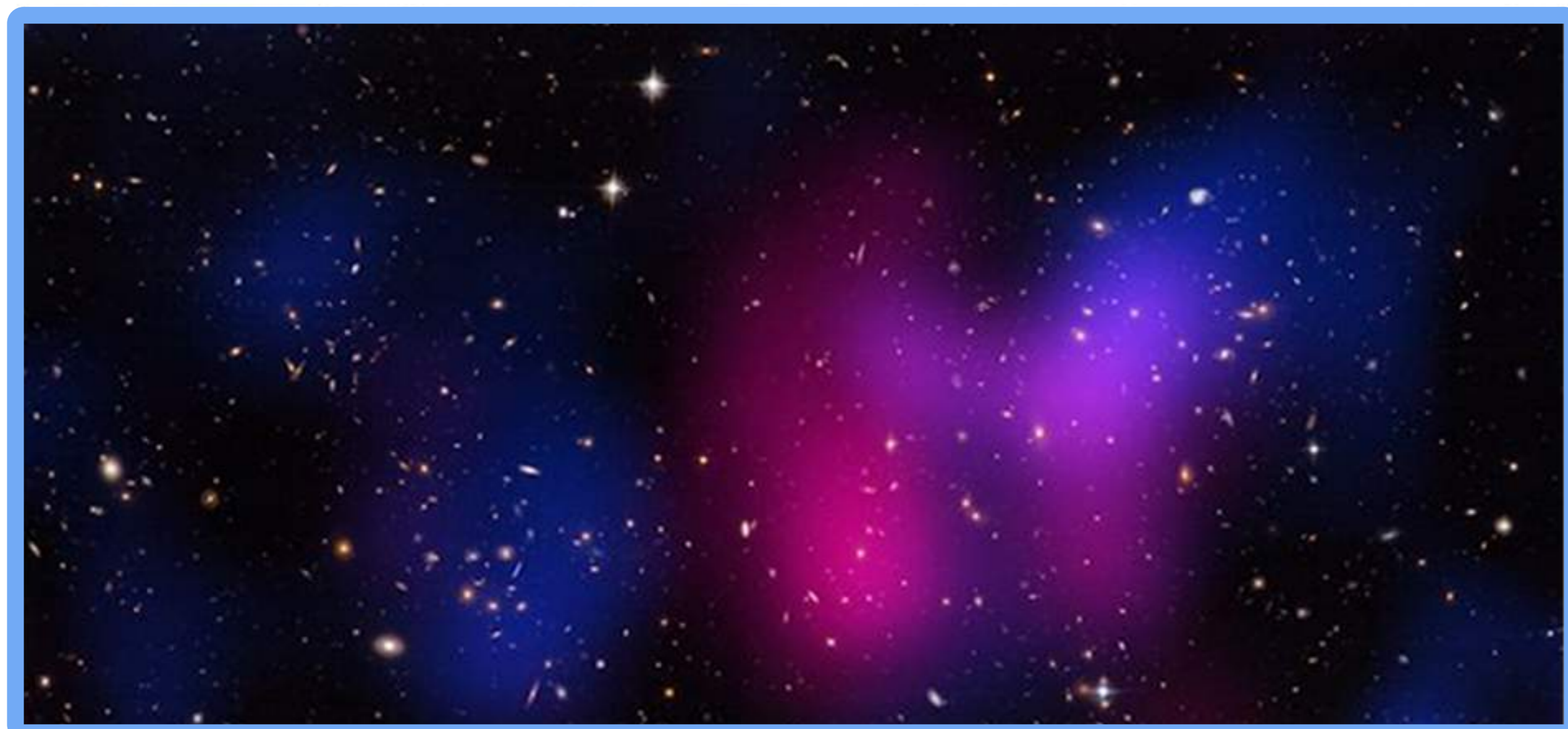
Figura 1: Exemplo de aglomerados de galáxia em colisão. Acima, o "Musket Ball Cluster" e abaixo o "Bullet Cluster"

Colisões de aglomerados de galáxias são eventos astrofísicos muito energéticos e suas características permitem que sejam grandes laboratórios para o estudo da matéria escura. Como esses eventos envolvem muitas componentes, são necessárias estratégias computacionais para estudá-los. Um das propostas é o código de Análise Dinâmica de Dawson (2013), que determina parâmetros do choque através da solução de equações de colisão.