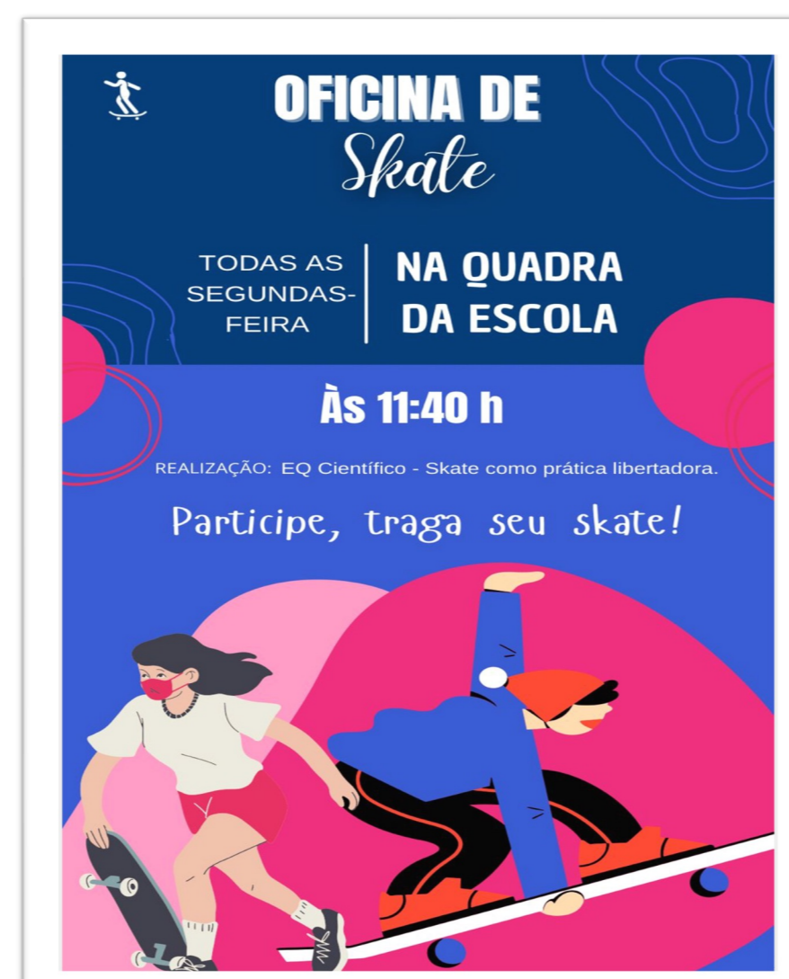
Convite da Oficina de skate.*