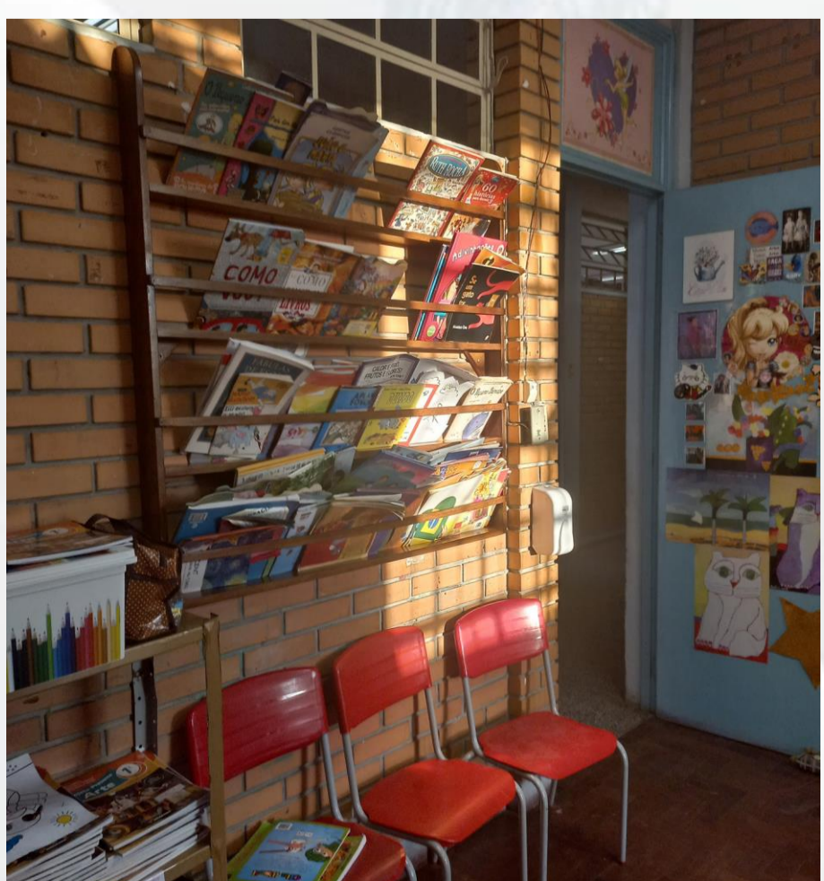
Figura 05: Sala de artes