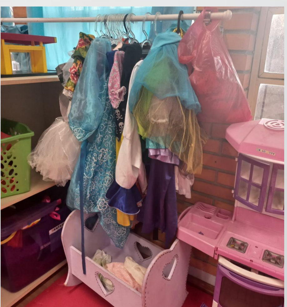
Figura 07: Jardim nível A2