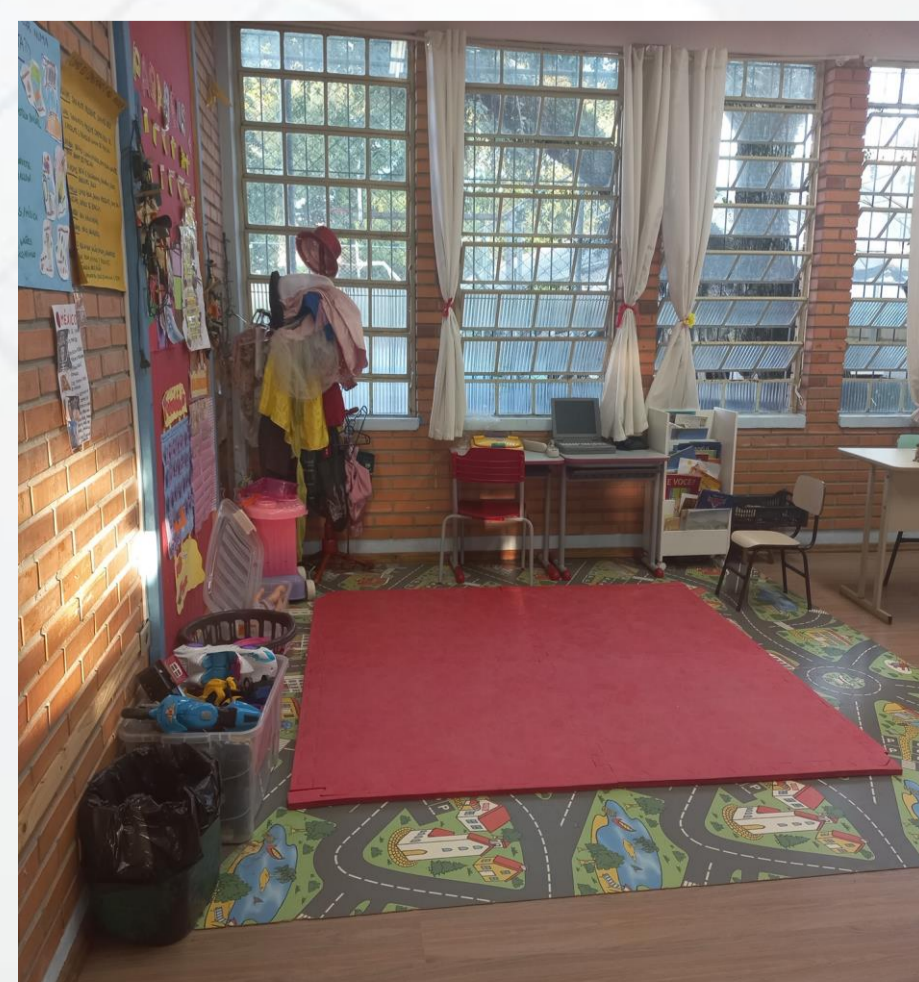
Figura 03: Jardim nível A1 e A3