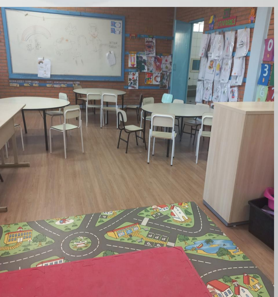
Figura 08: Jardim nível A1 e A3