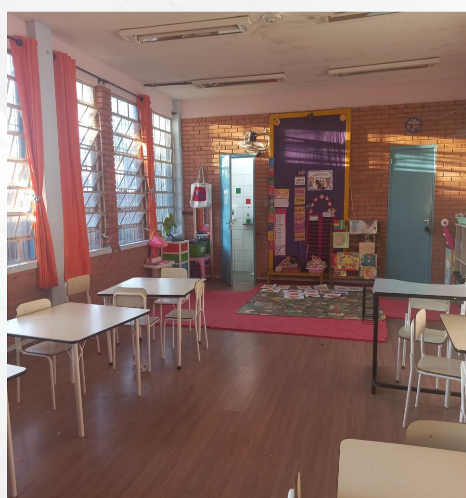
Figura 04: Jardim nível B1 e B2