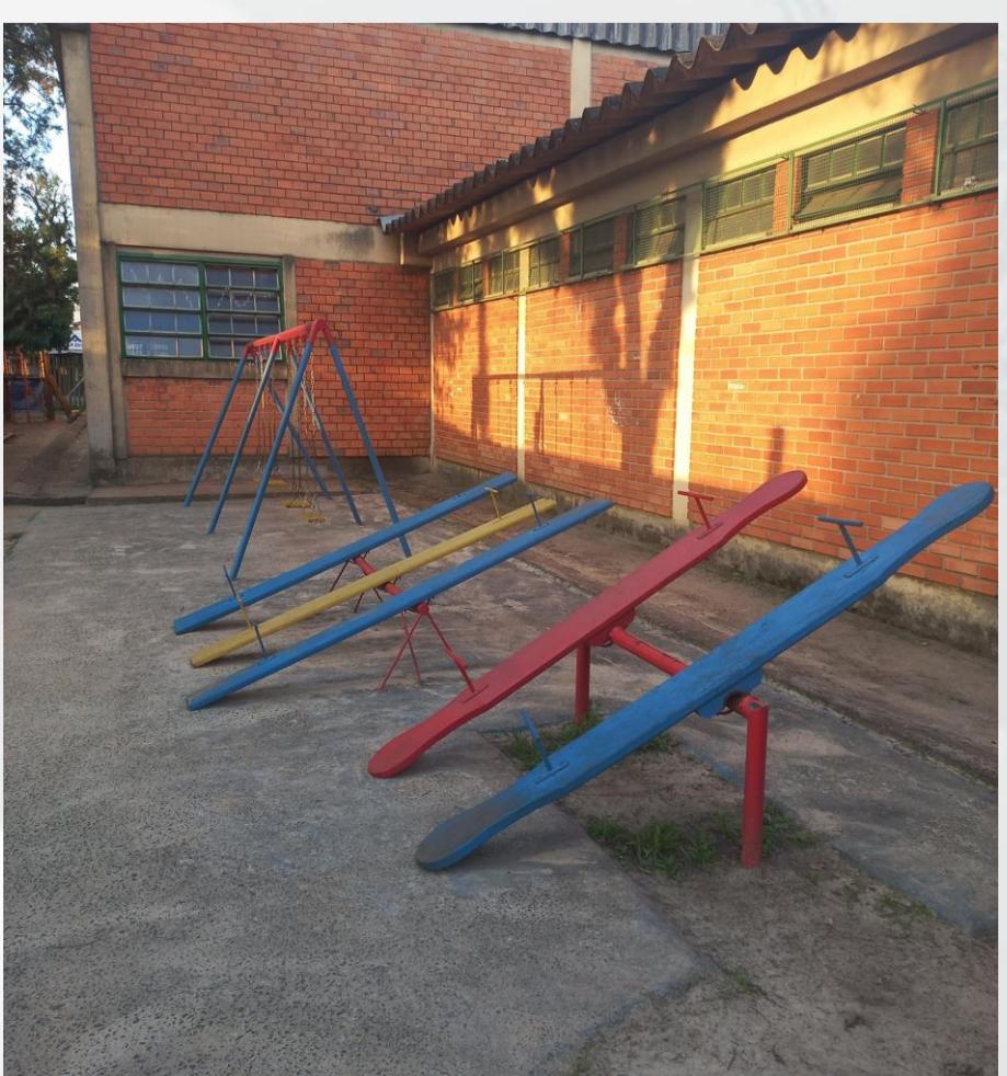
Figura 06: Praça