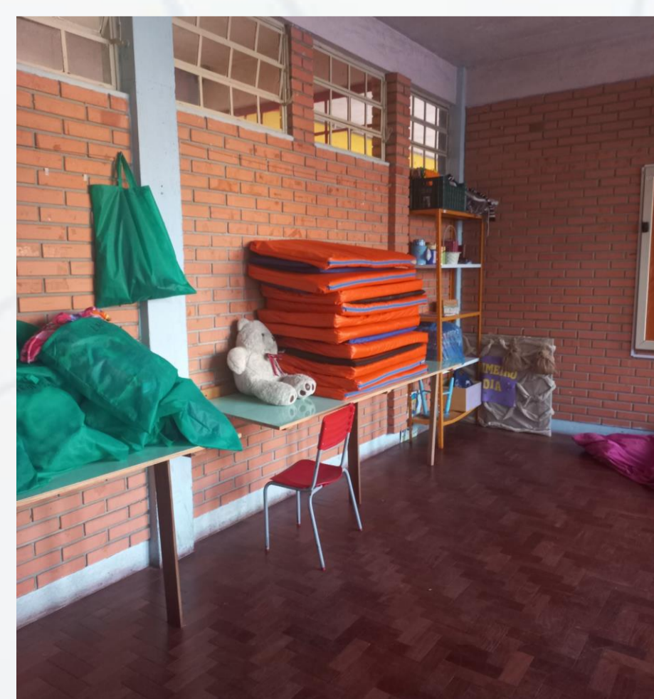
Figura 02: Sala multiuso

Por meio de: maior mediação dos pais, incentivo e exemplo.