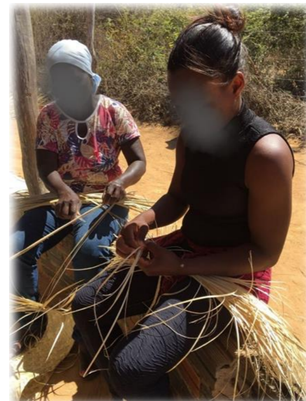
FIGURA 02: Mulheres Quilombolas