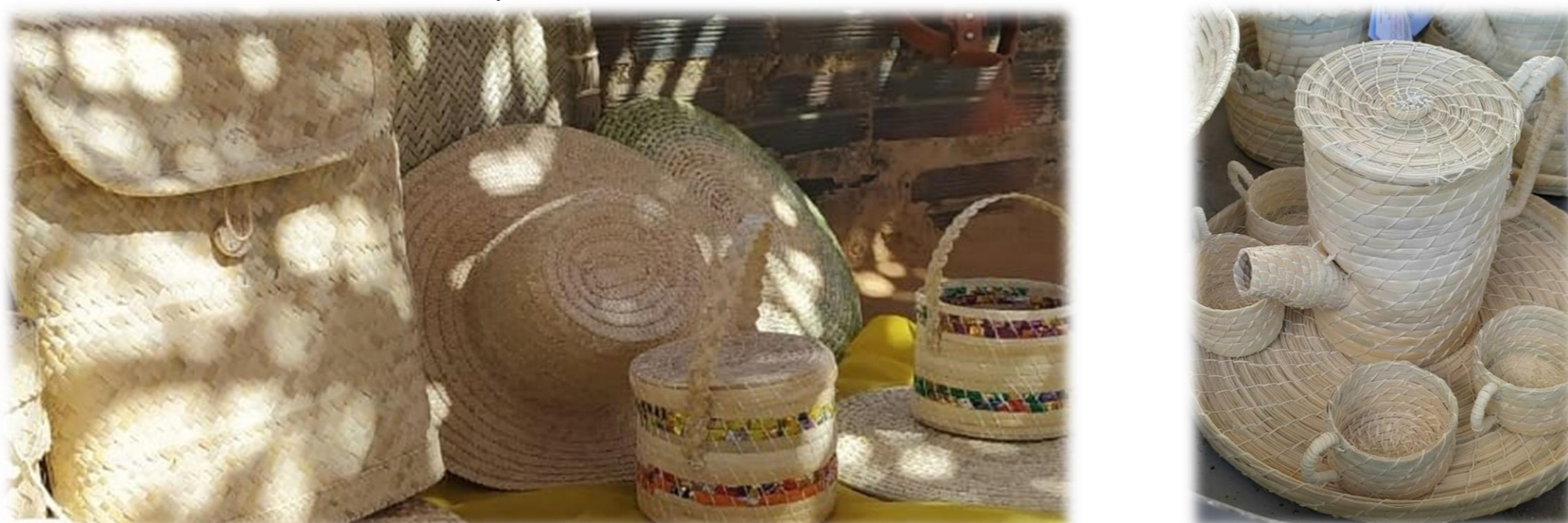
FIGURA 01 Artesanatos feitos pelas mulheres em estudo.

A rede de artesanato das mulheres quilombolas da comunidade Vargem do Sal, no município de Caetité-BA, iniciativa que começou a tomar forma no início dos anos 2018, quando parceiros institucionais e artesãos do semiárido baiano sentiram a necessidade de gerar sinergia, a fim de amenizar várias fraquezas e ameaças que rondavam as comunidades artesanais, tais como: falta de trabalho e renda para as artesãs; êxodo rural de jovens locais por falta de oportunidades de trabalho; cultura artesanal se perdendo no tempo e espaço; e falta de manejo adequado da extração da palha do licurizeiro.