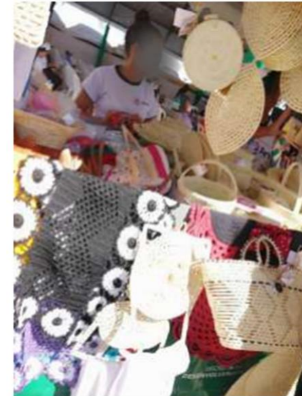
FIGURA 03: Mulheres Quilombolas em feiras