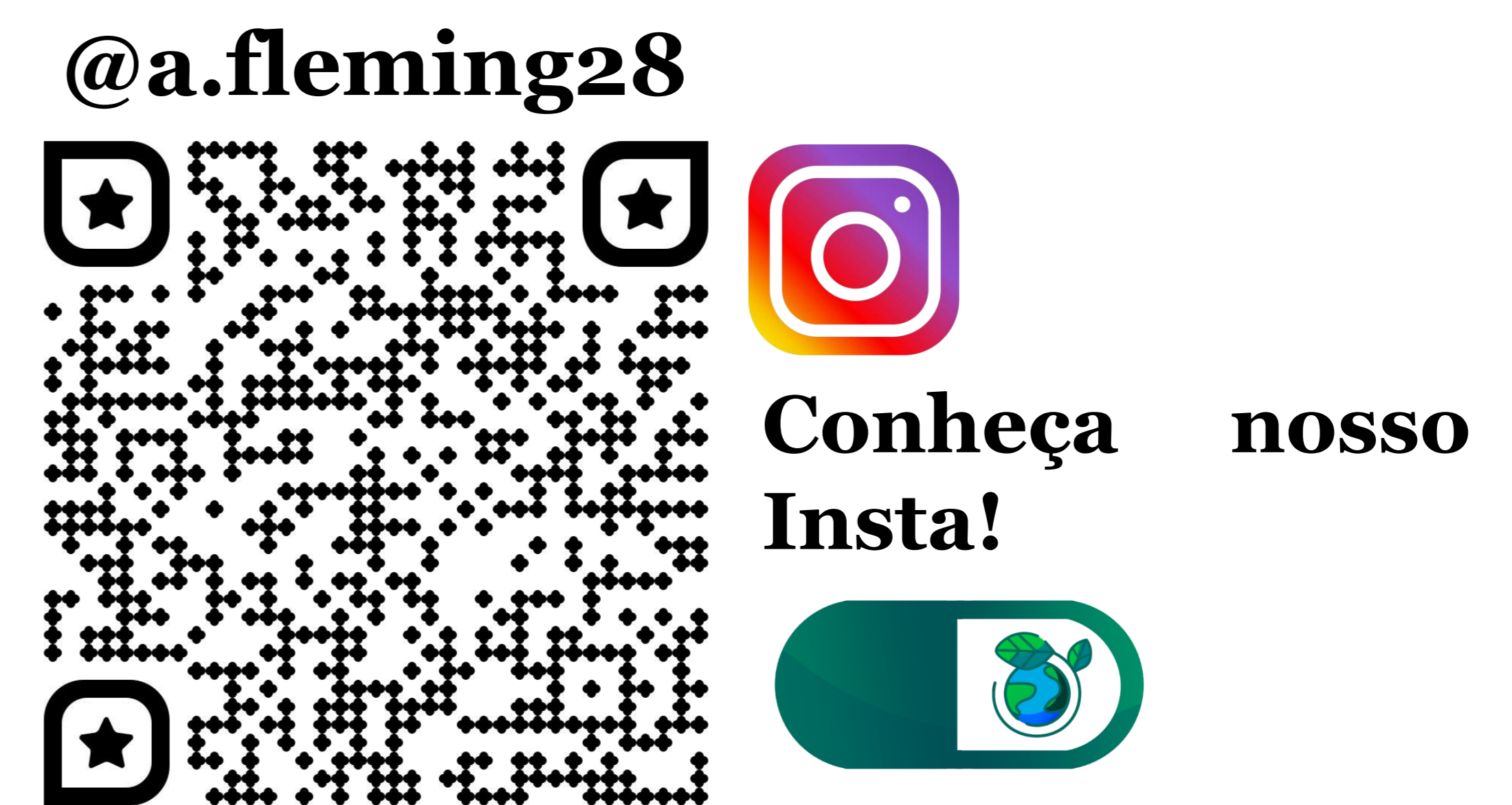
Figura 3- Qrcode para o Instagram

Contribuir para a disseminação de informações sobre o descarte correto de medicamentos e seus impactos, e tornar os totens de descarte acessíveis para pessoas deficientes visuais, apoiando a construção de uma sociedade mais sustentável e inclusiva para todos.