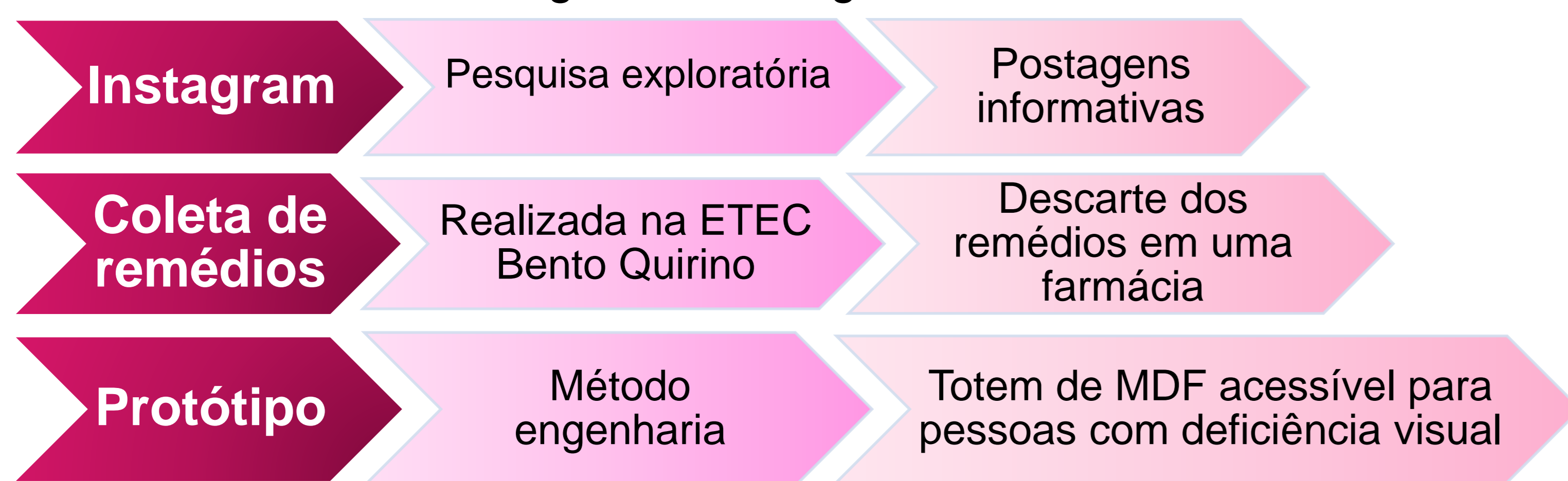
Figura 1- Fluxograma

O projeto possui três etapas principais: criação do Instagram, realização de uma coleta de medicamentos vencidos na escola e criação do protótipo de descarte com sistema eletrônico para acessibilidade dos totens de coleta.