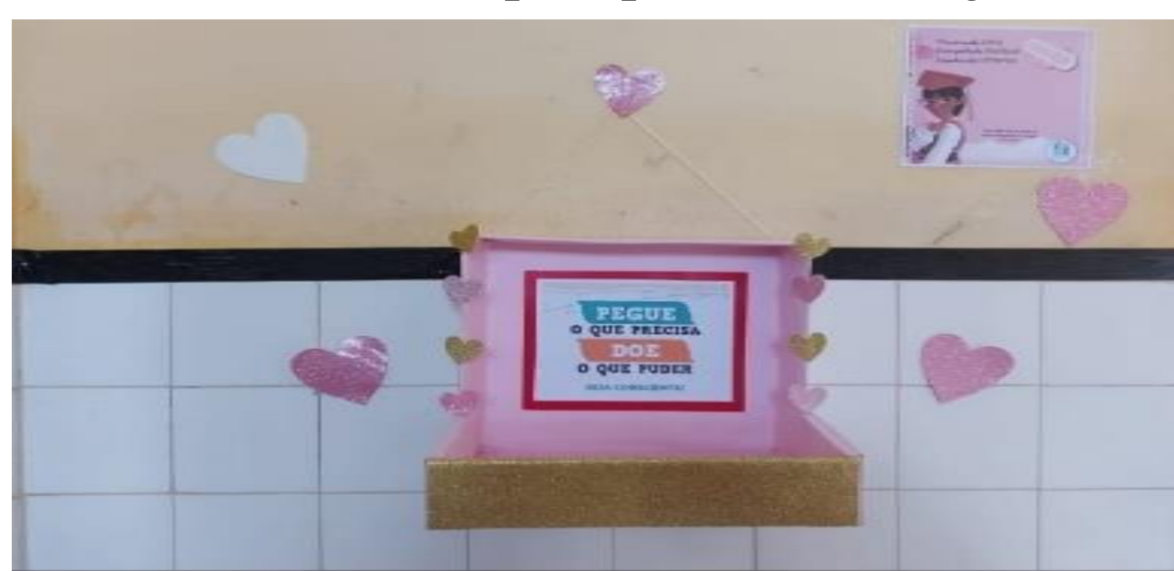
Imagem: Nossa casinha íntima