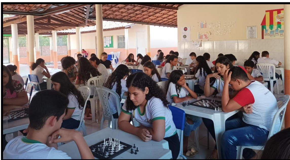
Imagem 7: Oficinas em que os alunos monitores ensinam Xadrez para alunos de outras turmas