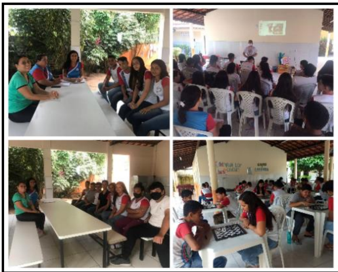
Imagem 5: Convites aos alunos monitores de Xadrez e aulas iniciais com um profissional da área.