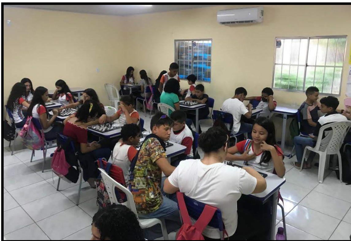
Imagem 8: Monitores de Xadrez do 8º e 9º ano ensinando Xadrez para os alunos do 6º ano