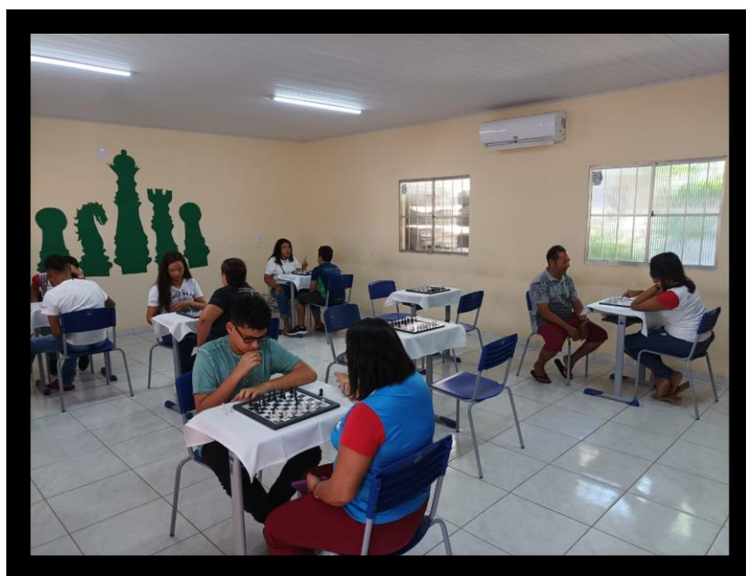
Imagem 2: Oficina de Xadrez no dia da Família da Escola

Outra grande conquista desse Projeto é constatar que mais de 95% dos alunos da escola FRD hoje sabem jogar xadrez, vide quarto gráfico . Ademais, esse Projeto constituiu-se num relevante aliado no combate à indisciplina, posto que, dentre as normas desse jogo, estão a cordialidade, respeito às regras, concentração e silêncio. Além disso, esse jogo ultrapassou os muros da escola, pois também realizou-se oficina de Xadrez para representatividade da comunidade.