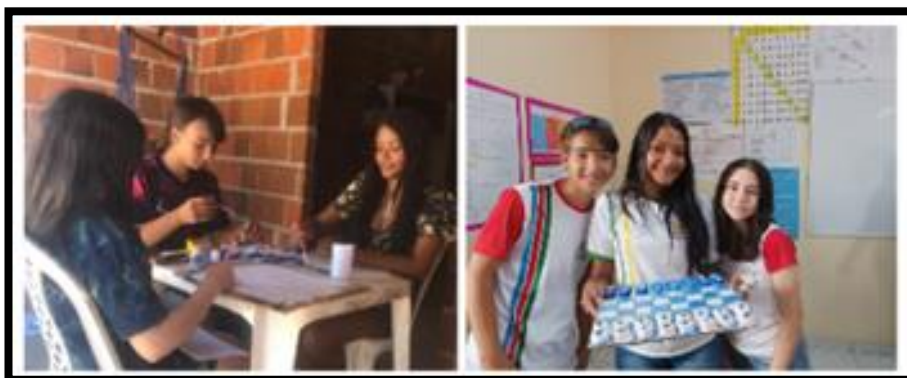
Imagem 4: Confecção de tabuleiros

Ademais, os alunos foram direcionados a produzirem seu próprio tabuleiro de Xadrez com materiais recicláveis. Desse modo, passaram a ter seus próprios tabuleiros, e assim, poderem praticar com familiares e amigos.