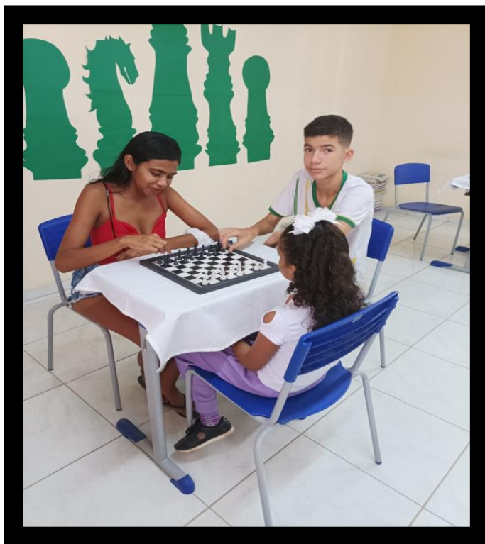
Imagem 3: Aluno do 7º ano ensina mãe e filha a jogarem Xadrez.