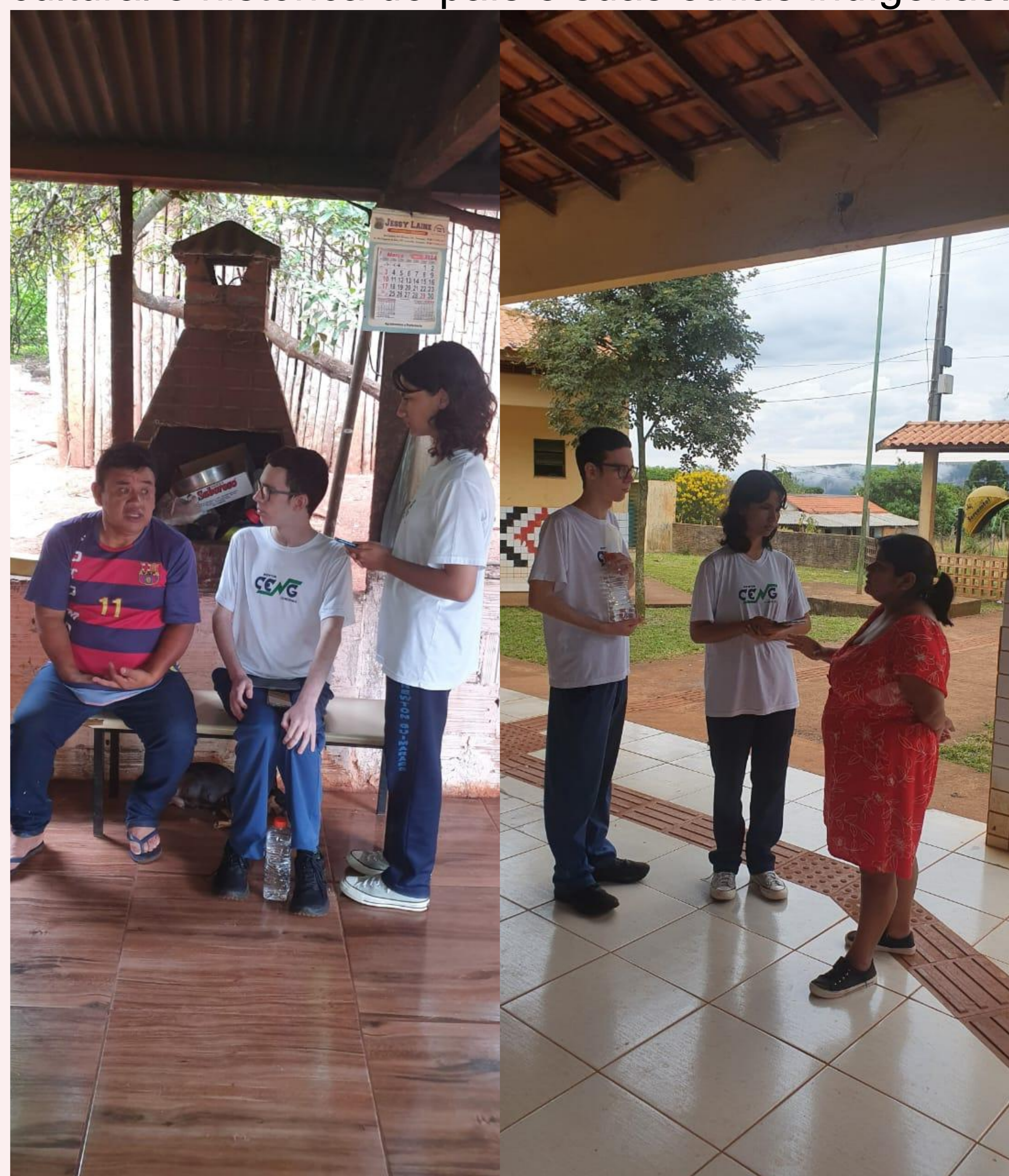
Visita à reserva Indígena Kaingang Apucarantina, localizada no município de Tamarana - PR.