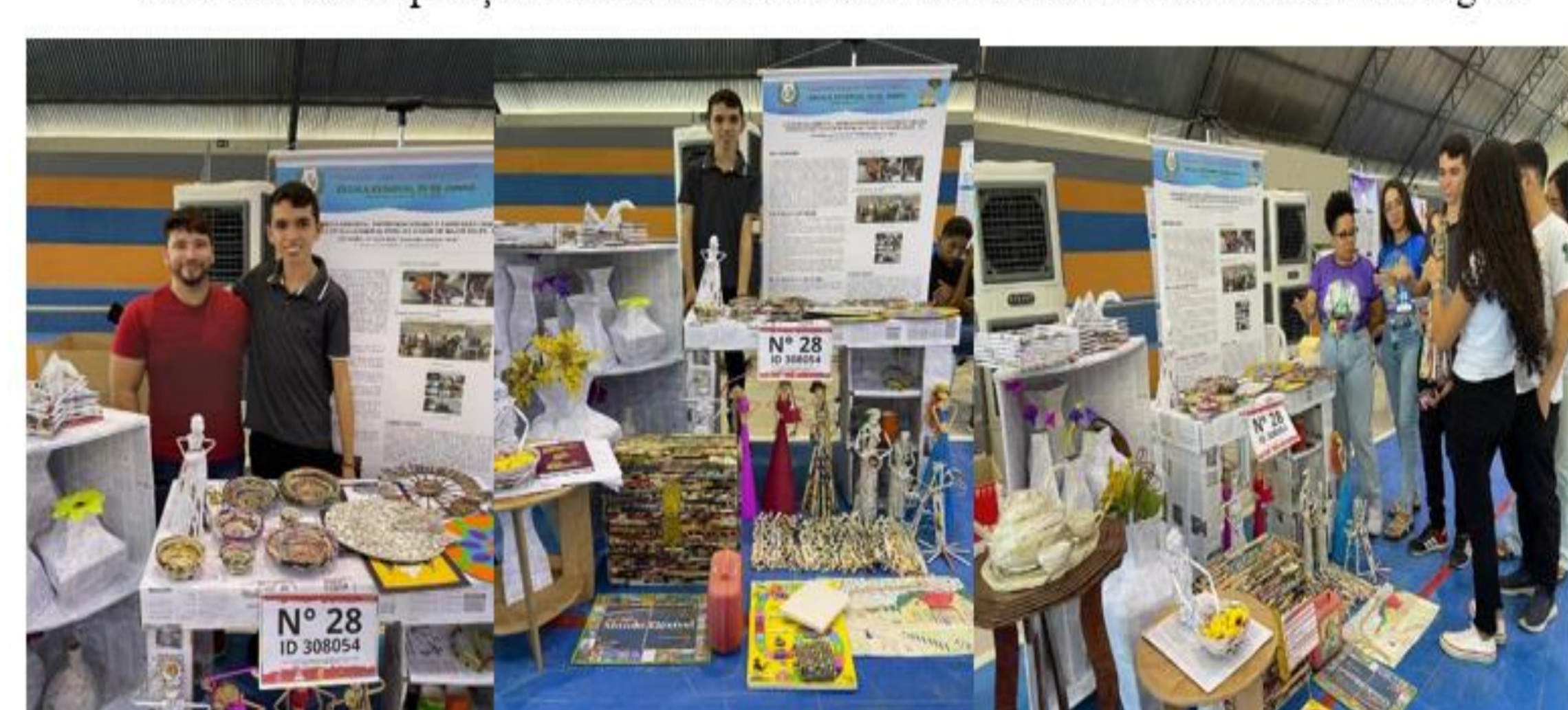
FIGURA 05: Exposição das obras de arte na Feira de Ciências do Alto Oeste Potiguar