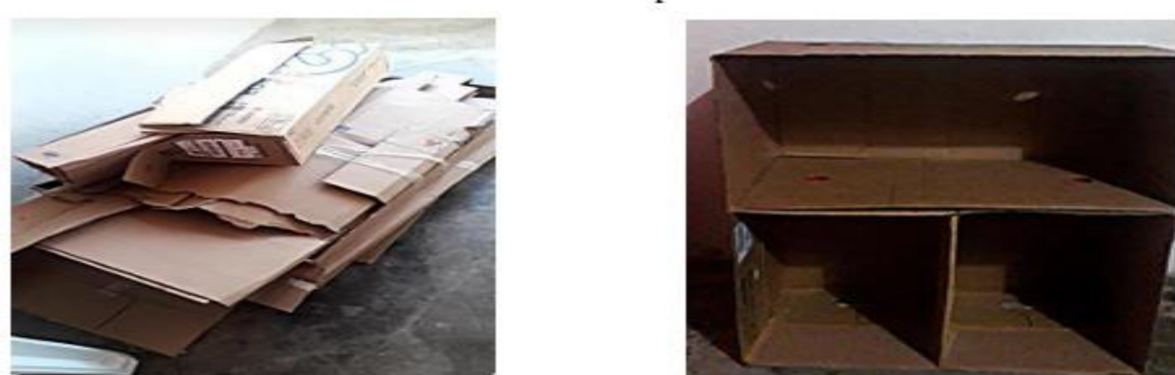
FIGURA 01: Caixas coletadas pelo estudante