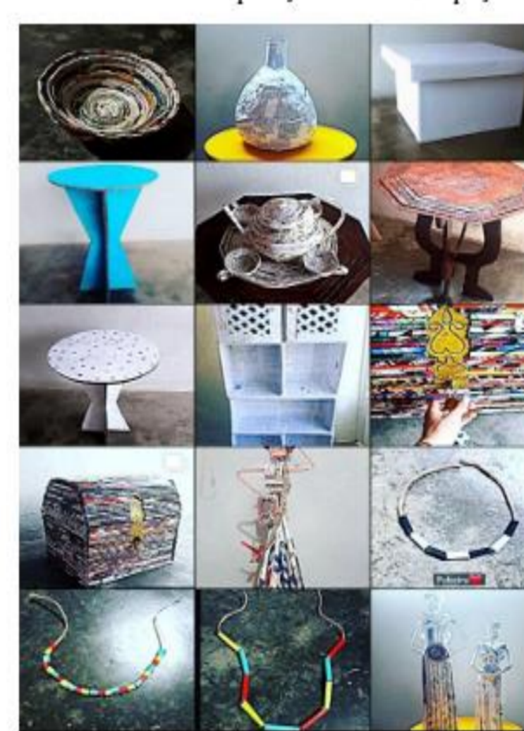
FIGURA 04: Exposição virtual das peças