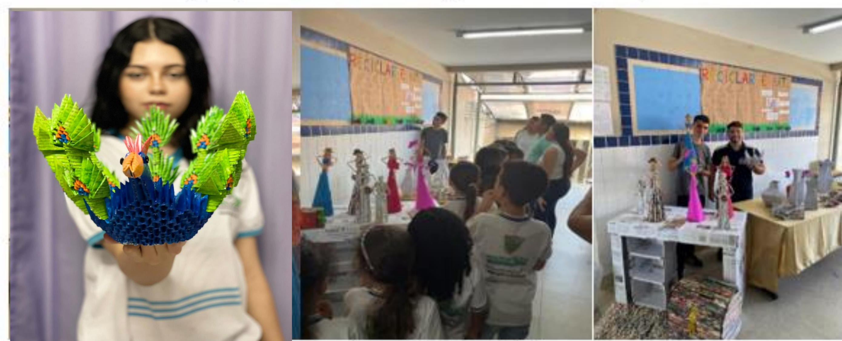
FIGURA 03: Exposição das obras de arte e palestra sobre arte e práticas sustentáveis