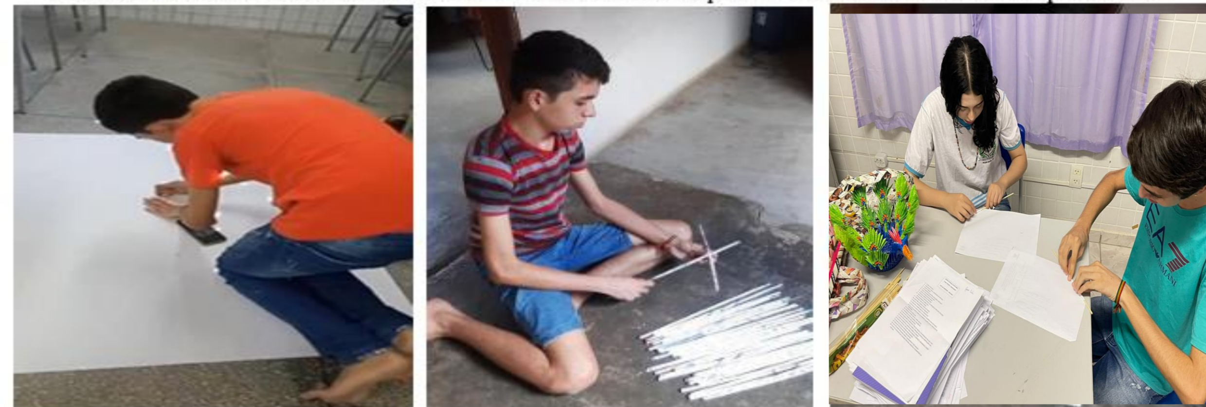
FIGURA 02: O estudante utilizando diversas técnicas para trabalhar o material reaproveitado