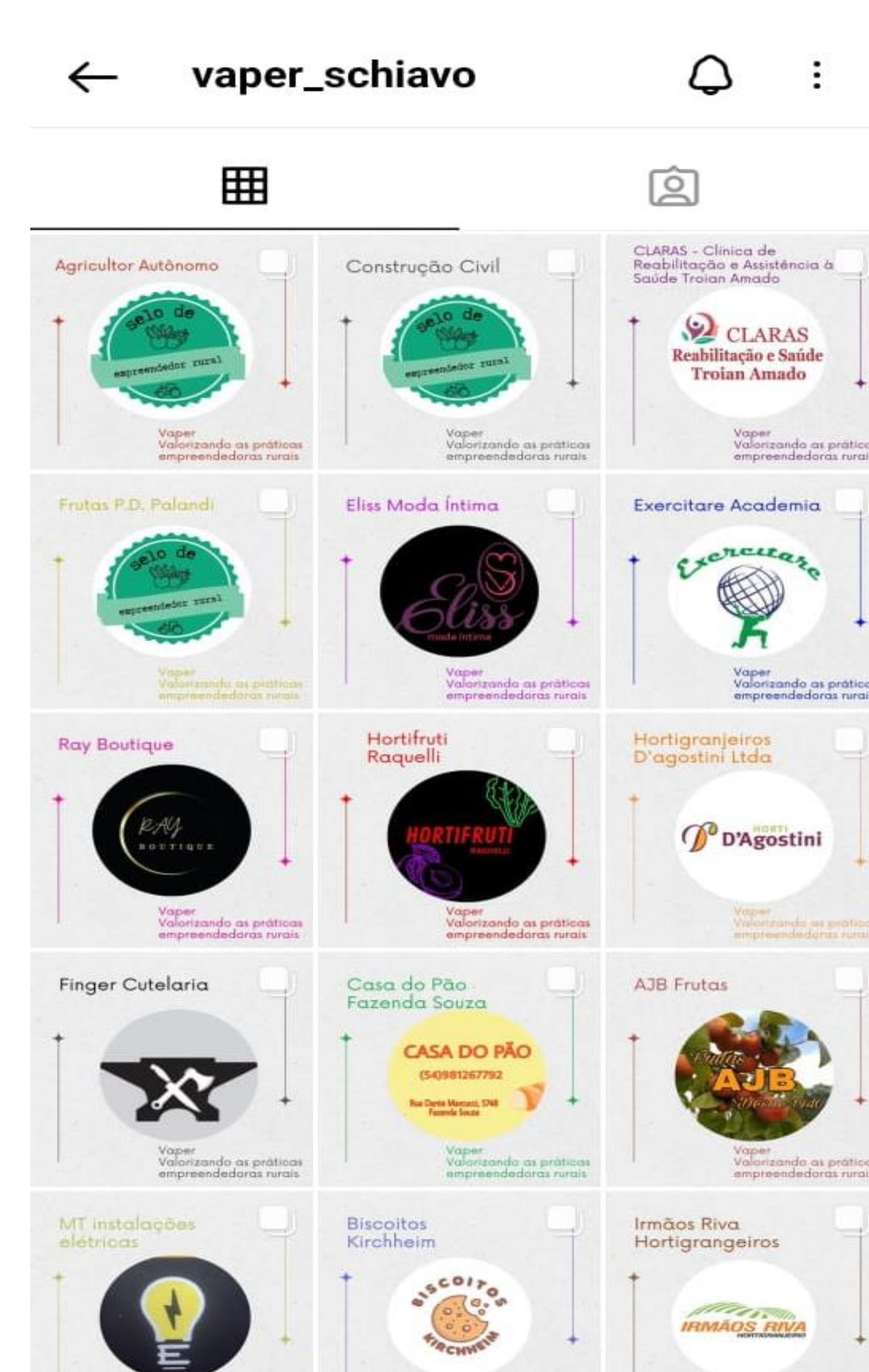
Imagem 2: Página Vaper completa.