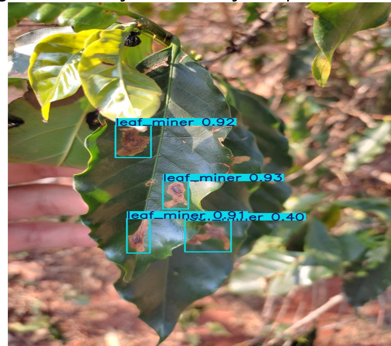
Figura 3: Predição de doença na planta de café.