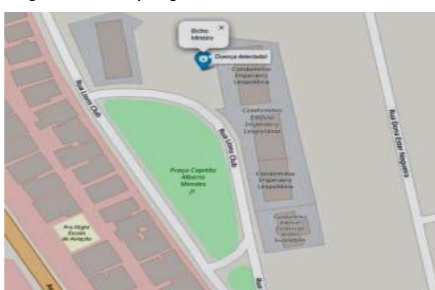
Figura 2: Mapa gerado com um marcador.