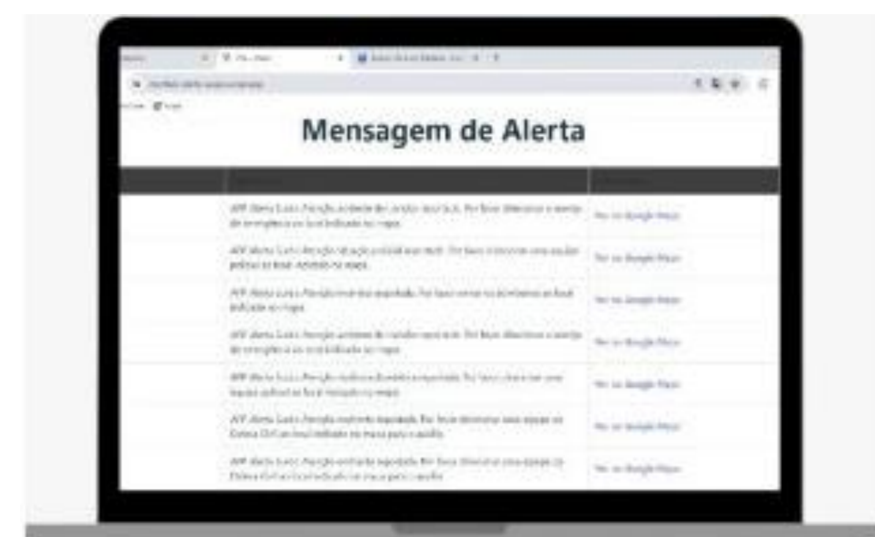
Figura 3: Layout do sistema do Alerta Surdo, conforme visto a partir de computador do CIOSP