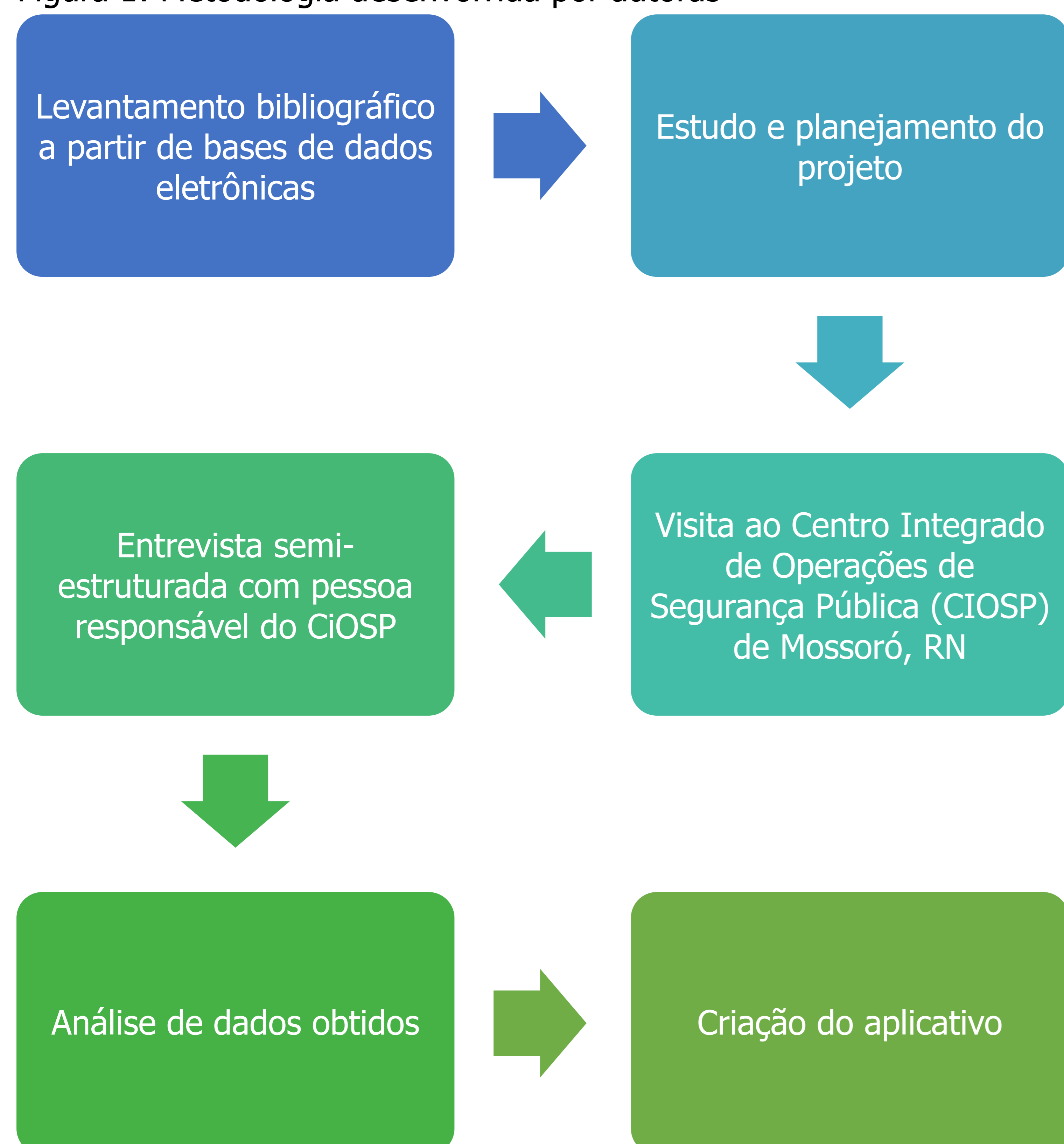
Figura 1: Metodologia desenvolvida por autoras

Em uma metodologia qualitativa, desenvolvemos as seguintes etapas metodológicas: